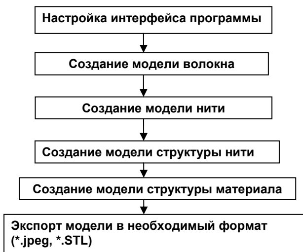
Рис. 1 – Алгоритм создания виртуальных моделей текстильных материалов

Настройка интерфейса программы включает: установку единиц измерения, установку параметров сетки и привязку. Установку единиц измерения и последующие действия проводим в среде ПО 3D Studio Max 8.0. Выбираем из предложенных вариантов систем исчисления «математическую». Устанавливаем минимальное миллиметровое значение для того, чтобы виртуальные модели соответствовали реальным по размеру. Это позволит создать минимальный объект в создаваемой системе - волокно с диаметром 22 микрометра. Минимальное значение для волокна может быть до 2 мкм. Следующим шагом является установка параметров сетки координат и их привязка к разрабатываемому объекту. Для этого устанавливаем требуемые интервалы сетки, которые позволяют выставить значения, характеризующие модели волокна, нити, ткани с возможностью изменения масштаба